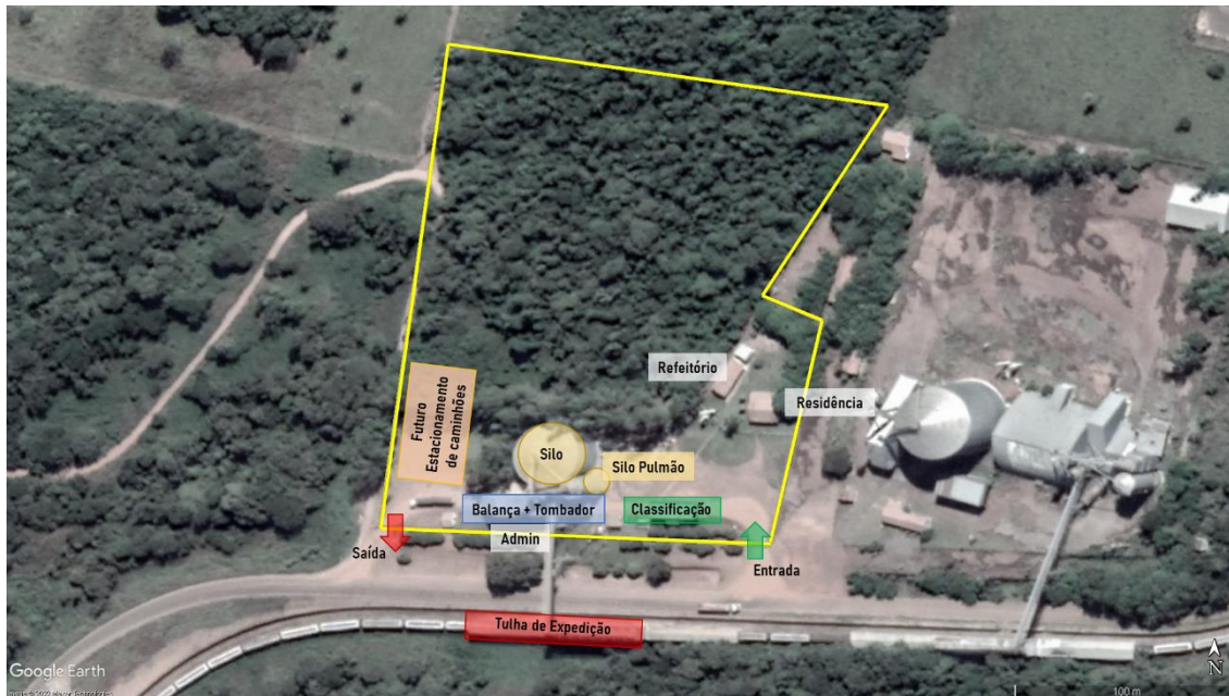
Figura 3 - Layout básico do Terminal de Graneis Sólidos Agrícolas.

No que tange à capacidade estática, o terminal proposto está projetado para armazenar 7450 toneladas de produtos, divididos em: