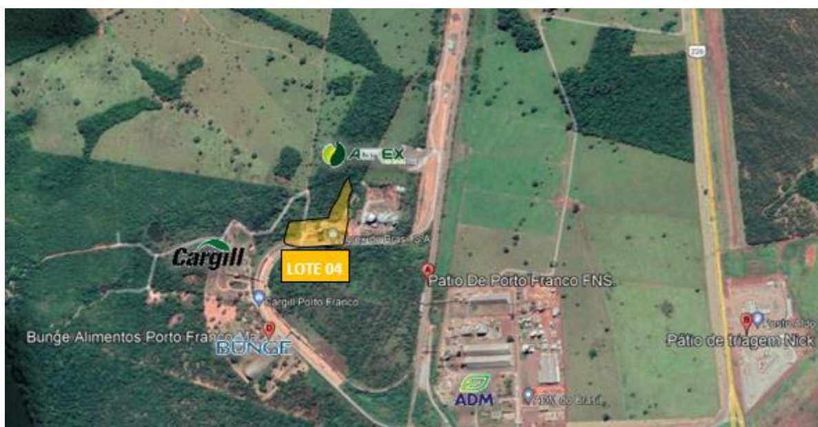
Figura 1 – Lote 4, situado no Pátio de Porto Franco.

O pátio de Porto Franco é um dos polos de carga ao longo da Ferrovia Norte-Sul (FNS), com a função de atuar como centro de transferência de cargas e serviços logísticos, ancorados em uma operação ferroviária. O transporte é intermodal, a utilizar dois ou mais modos de transportes, sendo especificamente no pátio utilizados os modos rodoviário e ferroviário.