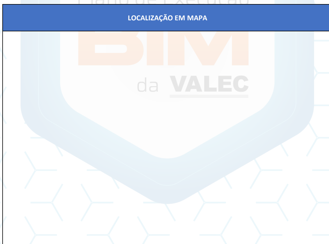
Quadro 8 - Localização em mapa