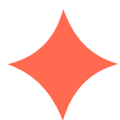
TABELA DE VALORES INFRA S.A